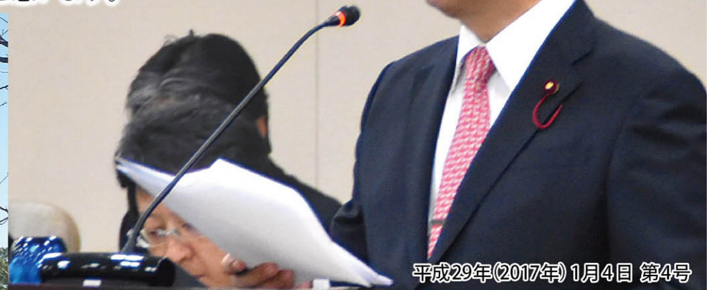
平成29年(2017年)1月4日 第4号