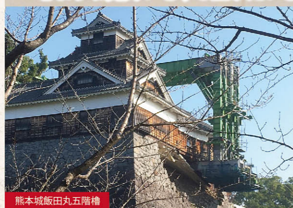
熊本城飯田丸五階櫓

昨年忘れられない一年となりました。新たな年を様々な思いで迎えておられることと思います。いまなお生活再建の途上にある方々に心よりお見舞いを申し上げます。