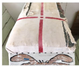
地震後、屋外で使用したため体育用具がぼろぼろに。