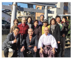
神社の復活で地域が元気になりました。