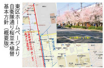
倒木の恐れのある危険な木を除去。その後、植替えや新規植栽により再整備。