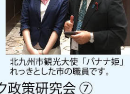
北九州市観光大使「パナ姫」れっきとした市の職員です。