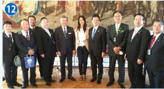
詳細は4面をご覧ください。